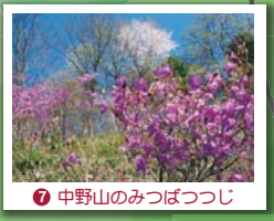
⑦ 中野山のみつばつじ