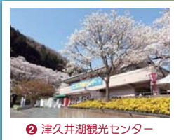
② 津久井湖観光センター