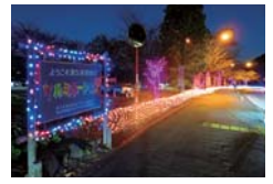
① 津久井湖城山イルミネーション