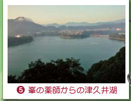
⑤ 峯の薬師からの津久井湖