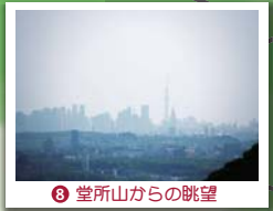
⑧ 堂所山からの眺望