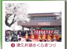
③ 津久井湖さくらまつり