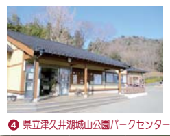
④ 県立津久井湖城山公園パークセンター